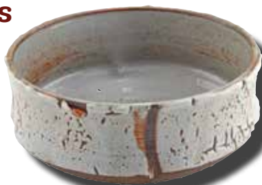
Fabienne FAUVEL (B)

Preisträger des EUREGIO- Keramikwett- bewerbs 2018